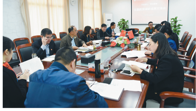
我校采用多种形式扎实开展“不忘初心 牢记使命”主题教育活动,走访师生、深入各学院向师生党员讲授党课,传达学习党的十九届四中全会精神。