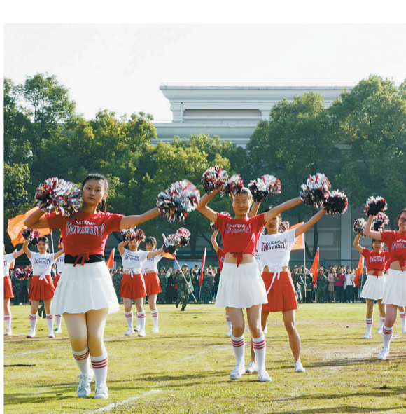
运动会开幕

开幕式现场,由教官队组成的国旗方阵队、校旗方阵队、会徽方阵队、彩旗方阵队、裁判员方阵队以及各学院代表队依次出场。他们精神饱满,气宇轩昂,迈着整齐划一、铿锵有力的步伐,嘹亮的口号彰显着无畏和斗志,青春的激情从他们身上迸发。学校武术队、体育和艺术部分别带来了精彩纷呈的体育艺术表演,在表现本次运动会