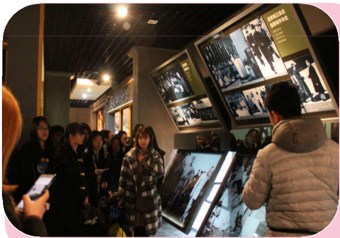
参观走访周恩来故居