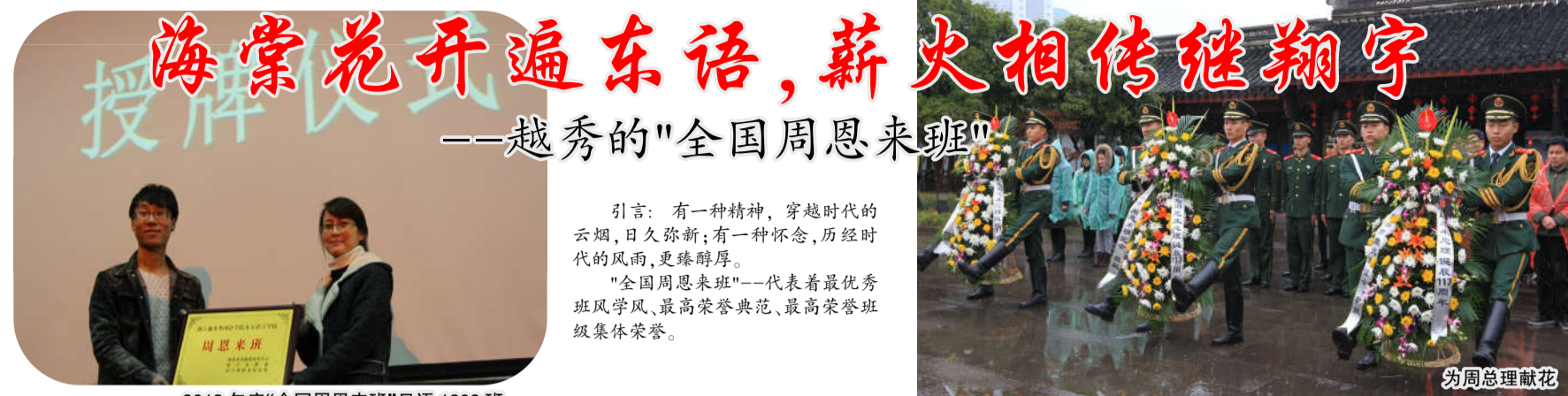
2013年度“全国周恩来班”日语1209班