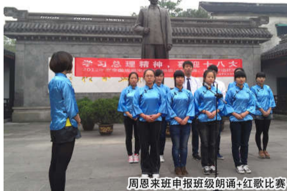
周恩来班申报班级朗诵+红歌比赛

周恩来诞辰日、逝世日更是作为重点工作开展。学生在学习和生活的点点滴滴中，周恩来精神逐渐渗入每位学生心中，从此破土发芽茁壮成长。在周恩来精神的引领下，找到自己的专业特长，发挥个人优势，实现自我成长，为社会做出自己的贡献和力量。