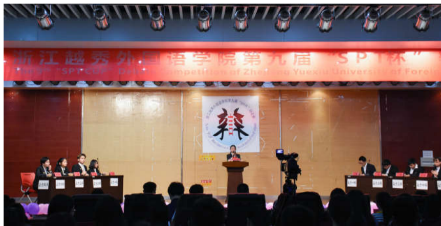
校团委举行第九届 SPT 杯辩论赛

刘家思教授希望《新世纪东南亚华文微型小说精选》与《新世界东南亚华文小说精选》两本书在经过本次研讨会的交流讨论后,尽快正式出版。(胡晗)