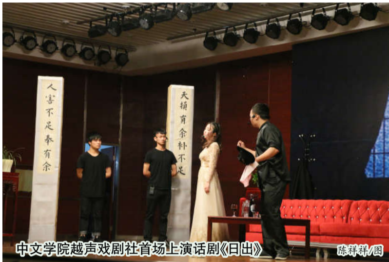
中文学院越声戏剧社首场上演话剧《日出》