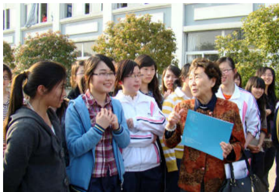
周恩来侄女周秉德来我校与周恩来班学生交流

引言：有一种精神，穿越时代的烟云，日久弥新；有一种怀念，历经时代的风雨，更臻醇厚。 “全国周恩来班”——代表着最优秀班风学风、最高荣誉典范、最高荣誉班级集体荣誉。